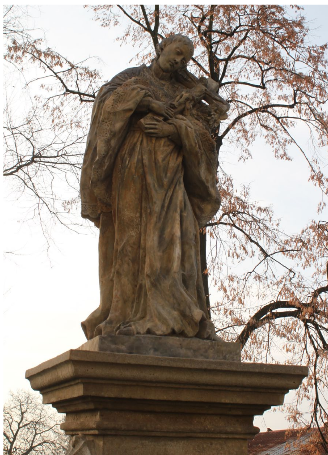
Svatý Alois je patronem mládeže a studentstva. Jeho atributem je lilie, kříž, lebka a růženec.