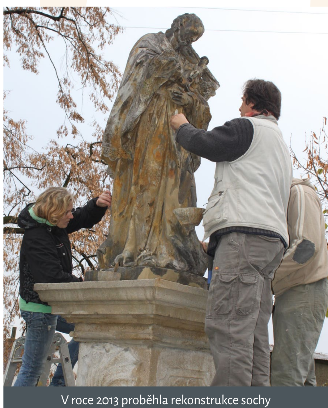
V roce 2013 proběhla rekonstrukce sochy