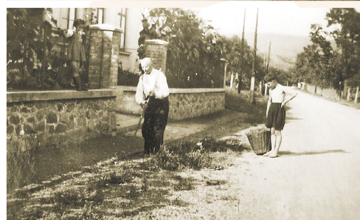
Tupecká škola na fotografiích z třicátých let minulého století