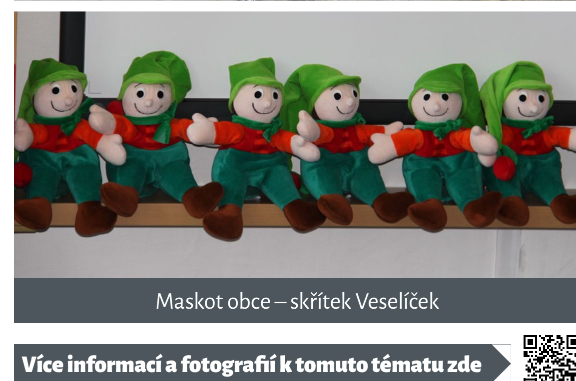
Maskot obce – skřítek Veselíček

Více informací a fotografií k tomuto tématu zde