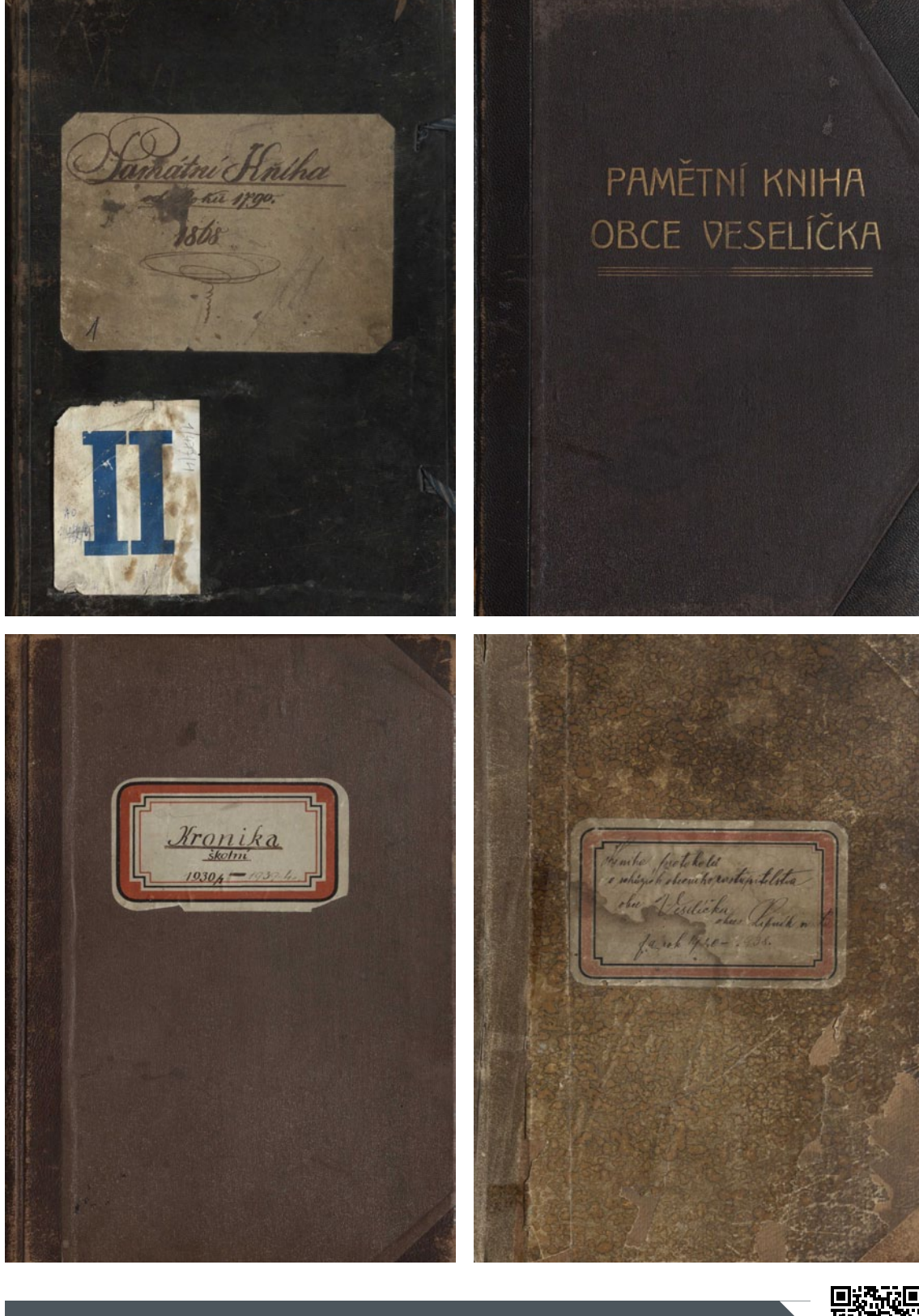
Více informací a fotografií k tomuto tématu zde

Po roce 1948 však došlo ke značnému zpolitizování kronikářské činnosti, které trvalo dlouhých 40 let. A tak vlastně i tyto kroniky vypovídají o době, kdy se psaly. Co se tedy z kronik dozvídáme? Je třeba si uvědomit, že ačkoliv měl být kronikář nezájímavý a nestranný, vždy se díváme na popisované události jeho pohledem. Zažloutlé stránky nás při pozorném čtení mohou dokonce vtáhnout do časů, kdy je zručný pisatel popsal tmavým inkoustem.