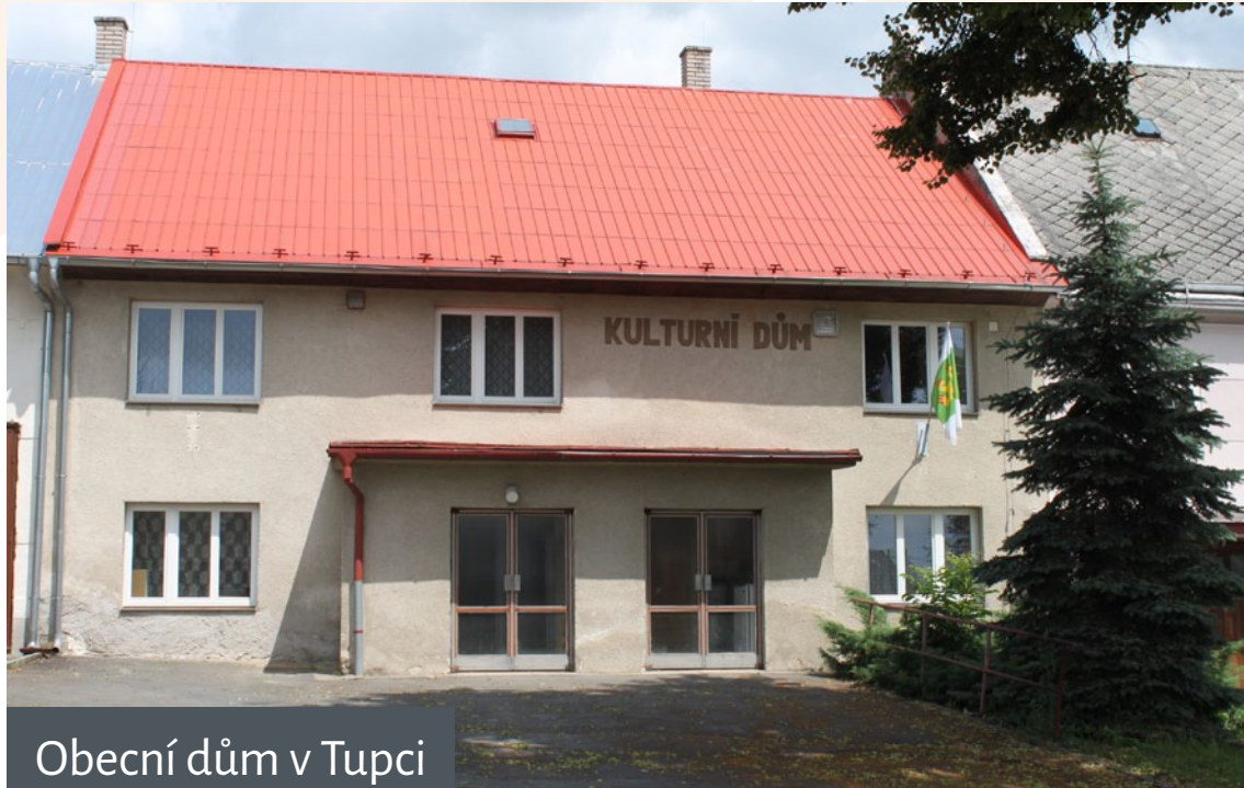
Obecní dům v Tupci