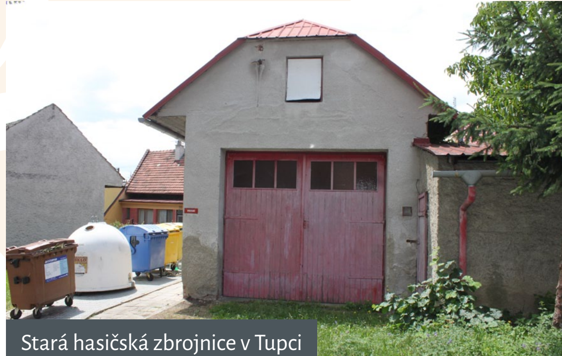
Stará hasičská zbrojnice v Tupci