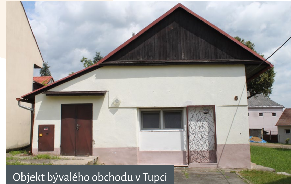
Objekt bývalého obchodu v Tupci