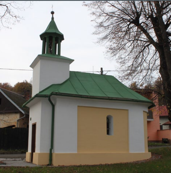
PĚŠÍ TRASA Tupecký okruh 4,2 km