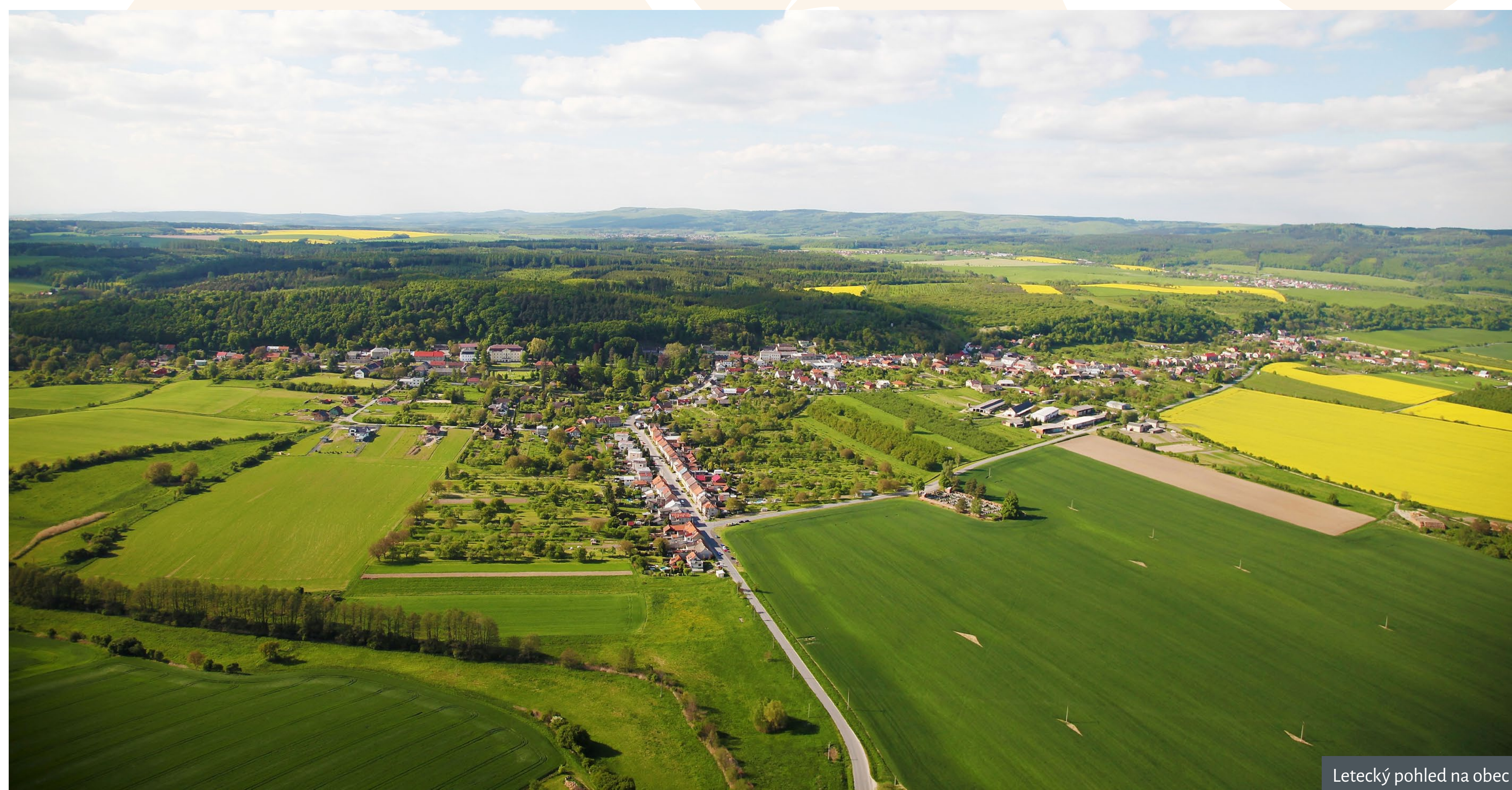
Letecký pohled na obec