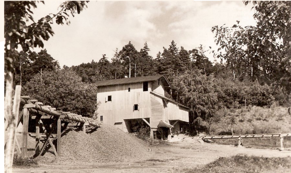
Více informací a fotografií k tomuto tématu zde