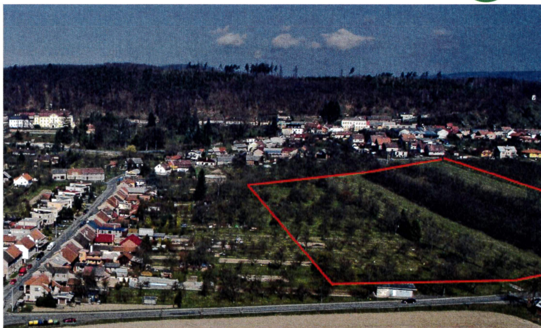
Jižní pohled na lokalitu Veselí – ve východní části je nová lokalita pro bydlení (v pozadí je zámek, obecní úřad a Zámecký kopec)